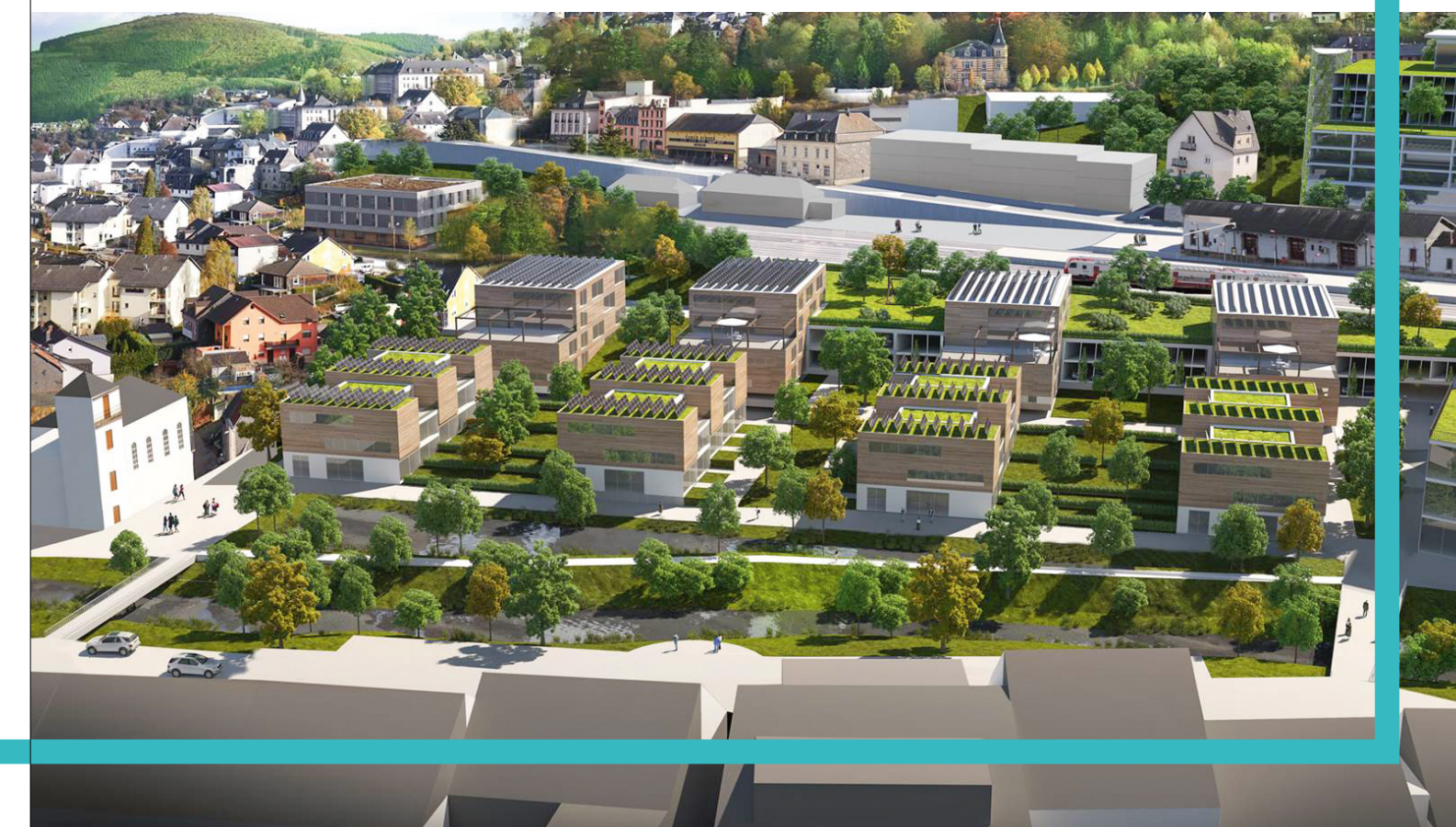
Die Infrastrukturarbeiten für die ersten Wohneinheiten im Projekt „Wunne mat der Wooltz“ sind fast abgeschlossen Les travaux d'infrastructure pour les premiers logements du projet « Wunne mat der Wooltz » sont en cours d'achèvement