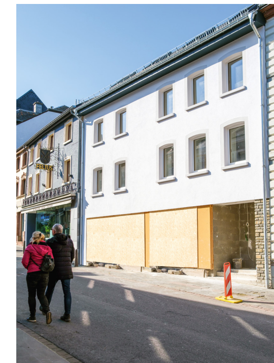
Aufwertung der Bausubstanz in der Grousgaass Revalorisation de bâtis existants dans la Grand Rue

Radovi na realizaciji projekta: "Wunnemat der Wooltz" su u završnoj fazi.