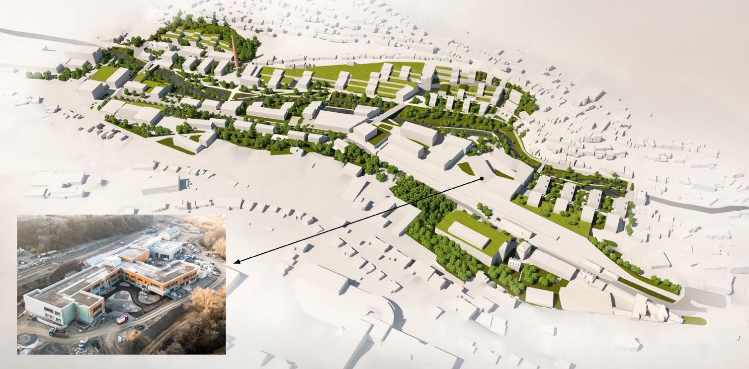
Das Projekt „Wunne mat der Wooltz“ mit Bildungscampus Le projet « Wunne mat der Wooltz » avec le campus éducatif